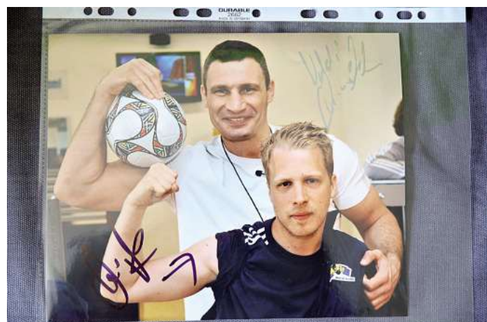
Stationen einer Sammler-Laufbahn: Politiker, Sportler, Fernsehmoderatoren und Schauspieler.